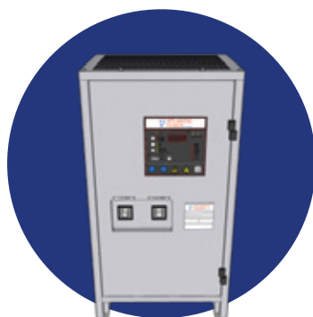
CARGADORES DE BATERIAS INDUSTRIALES