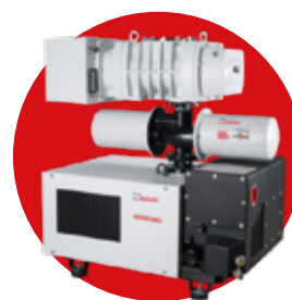
MAQUINA PARA EL TRATAMIENTO TÉRMICO DEL ACEITE