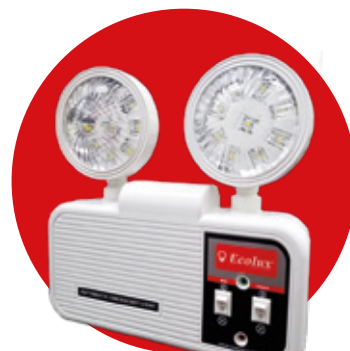
LUCES DE EMERGENCIA