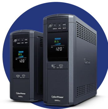
UPS TRIFÁSICOS MONOFÁSICOS