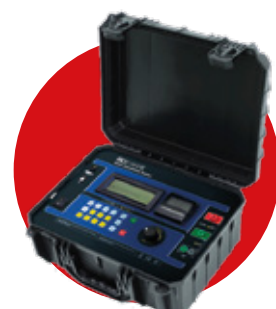
MEGÓMETRO MEDIDOR DE AISLAMIENTO