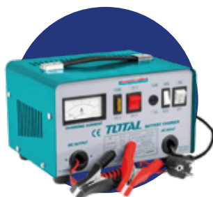
CARGADORES DE BATERÍAS INDUSTRIALES