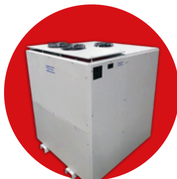
RECTIFICADORES INDUSTRIALES AC/DC