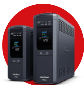
UPS TRIFÁSICOS MONÓFÁSICOS